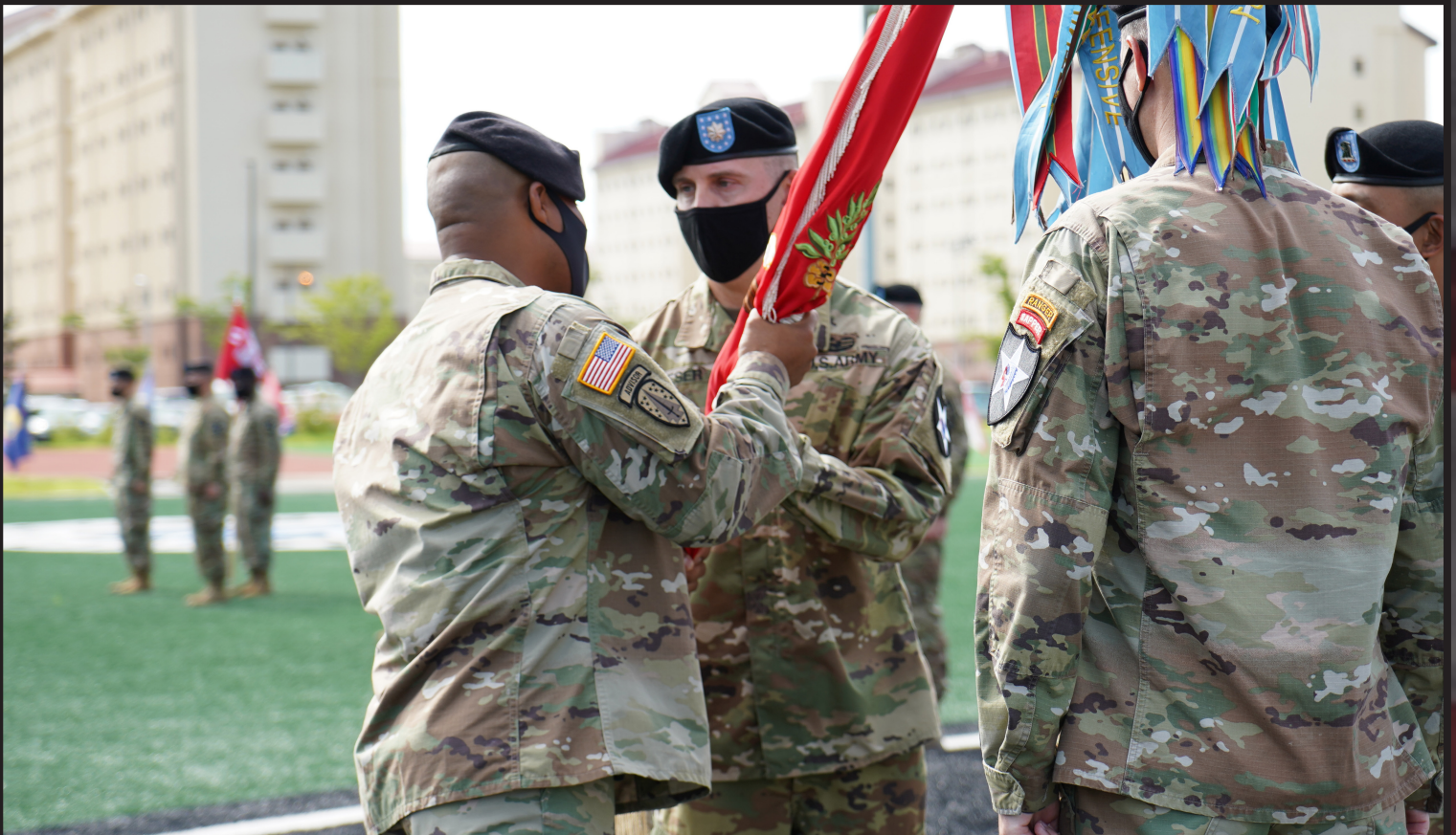
로빈 W. 몽고메리 대령이 2021년 7월 14일 미 제11공병대대 대대장 이취임식에서 마이클 D. 키저 중령에게 부대기를 이양하고 있다.

캠 프 험프리스, 대한민국 - 2021년 7월 14일 로버트슨 퍼레이드 필드에서 열린 이취임식에서 제2보병사단 지원여단 제11공병대대의 이임 대대장인 로버트 E. 디온 주니어 중령은 부대기를 마이클 D. 키저 중령에게 전달했다.