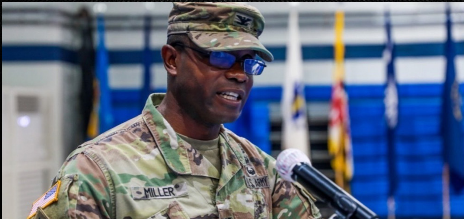
자바리 밀러 대령이 2021년 7월 12일 권한 이양식에서 연설을 하고 있다.

캐 프 케이시, 대한민국 - 제1기갑사단의 제3기갑여단전투단 ‘불독(Bulldog)’은 7월 12일 진행된 권한 이양식과 함께 순환기갑여단 전투단으로서의 책임을 맡았다.