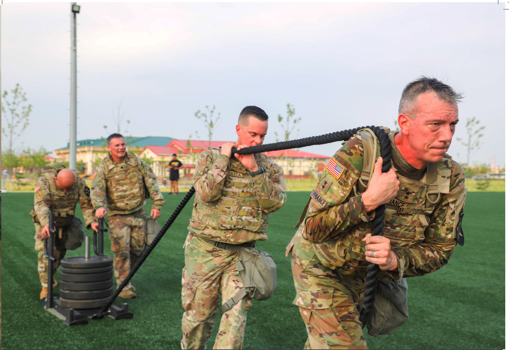
7월 28일 로버트슨 필드에서 연합사단 지휘부 및 참모부와 사단예하 부대 지휘부가 체력단련(Command Leadership PT)에 참여했다.