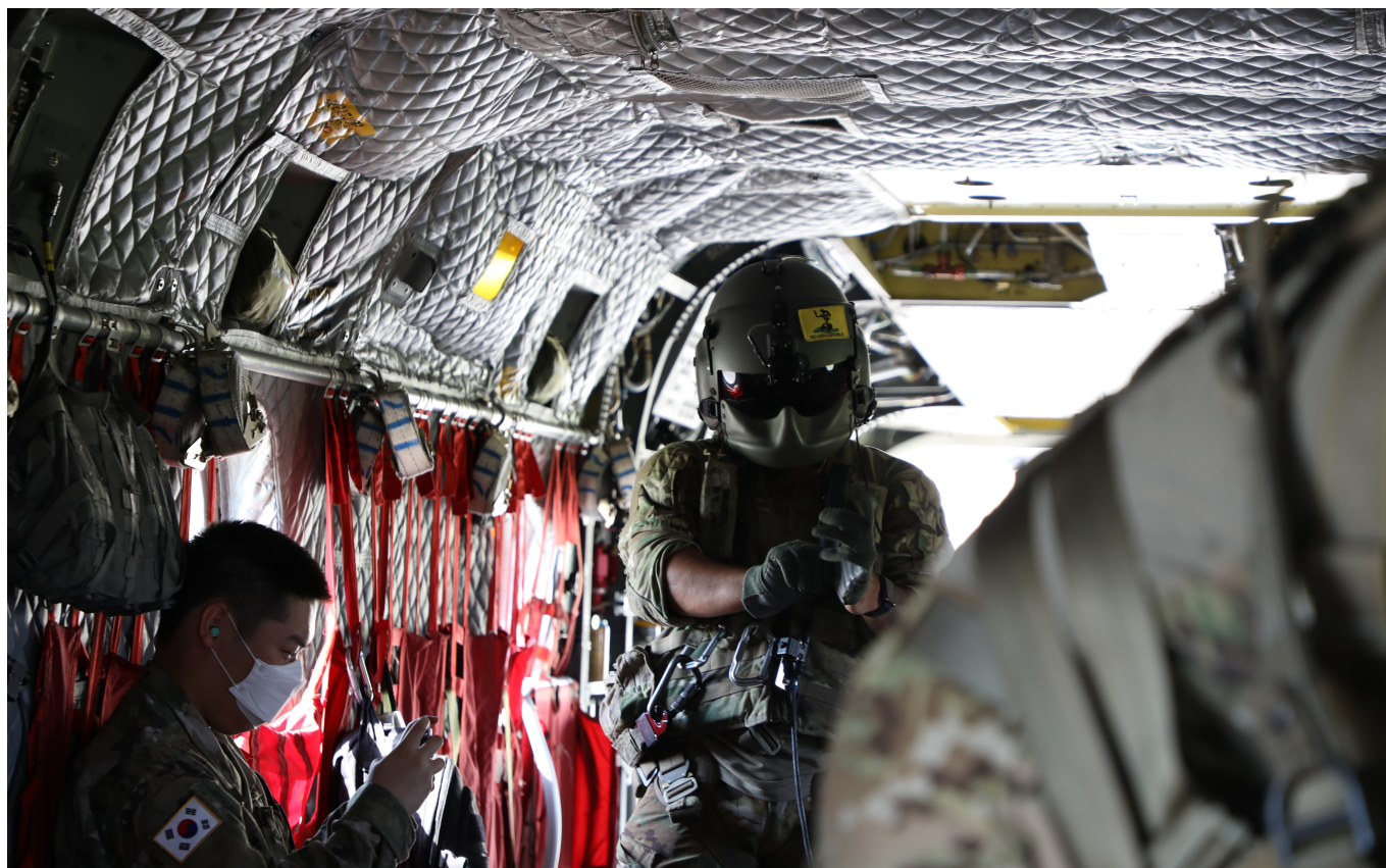
KATUSAs are getting ready to board the CH-47 Chinook helicopter at Camp Humphreys. 2nd Combat Aviation Brigade Soldiers wore their gear and made sure everyone had their safety belts on to fly.