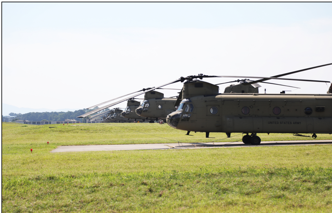
On July 22, the Chinook is the Army's heavy-lift cargo helicopter, which supports combat and other critical operations. Through this experience, KATUSAs gained a better understanding of the 2nd Infantry Division's aerial operations.