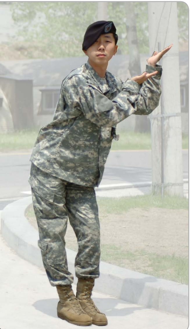
<기사 및 사진_상병 정호영/편집인>

신-제때 졸업하고 싶다. 제대 후 복학해서 마광수 교수처럼 색깔있는 교수가 되어 강단에 서며 후진을 양성하고 싶다. 혹은 이공계 국립 연구소에 들어가 신소재를 개발하고 싶다. 또 미국 스탠포드 대학원에 진학하고 싶다. 그리고 부모님께 드릴 말씀이 있다. 대학생때 학교도 받고 질풍노도의 시기를 길게 보낸 것 같다. 부모님께 칭찬을 별로 못 받아 봤다. 앞으로는 부모님께 자랑스럽게 소개할 수 있는 멋진 아들이 되고 싶다.