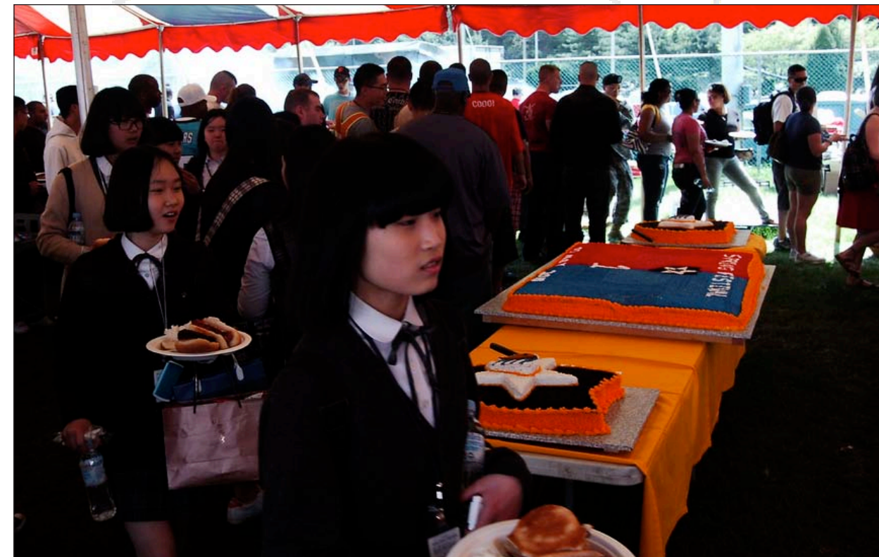
Korean students from local Dongducheon schools enjoy the food and festivities offered during the 1st HBCT Spring Festival held on the Camp Casey Carey Field May 7.