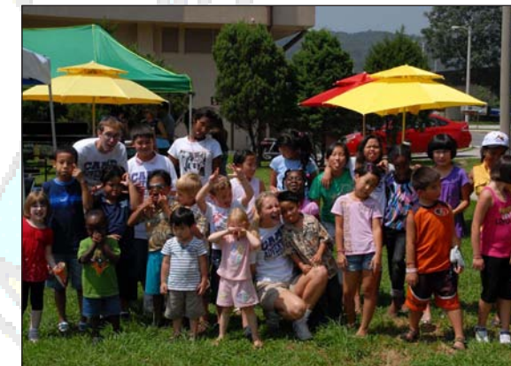
Children strike a pose during the 2009 Camp Adventure held at the Camp Casey Community Activity Center.