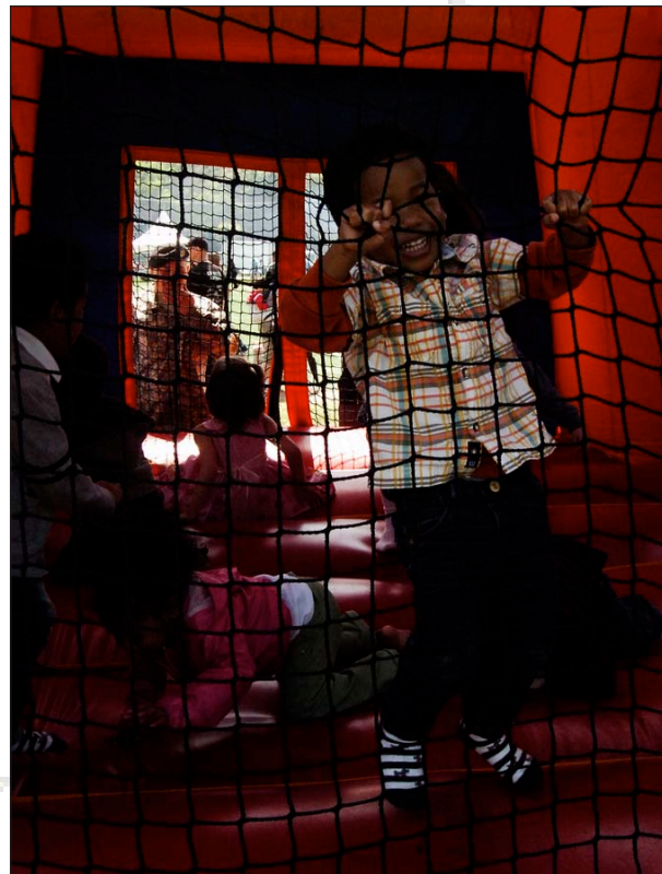
Iron Brigade children have a jumpin' good time alongside children from local Dongducheon schools during the 1st HBCT Spring Festival held on the Camp Casey Carey Field May 7.

"Events such as these are great morale boosters for the Soldiers," said Griffiths.