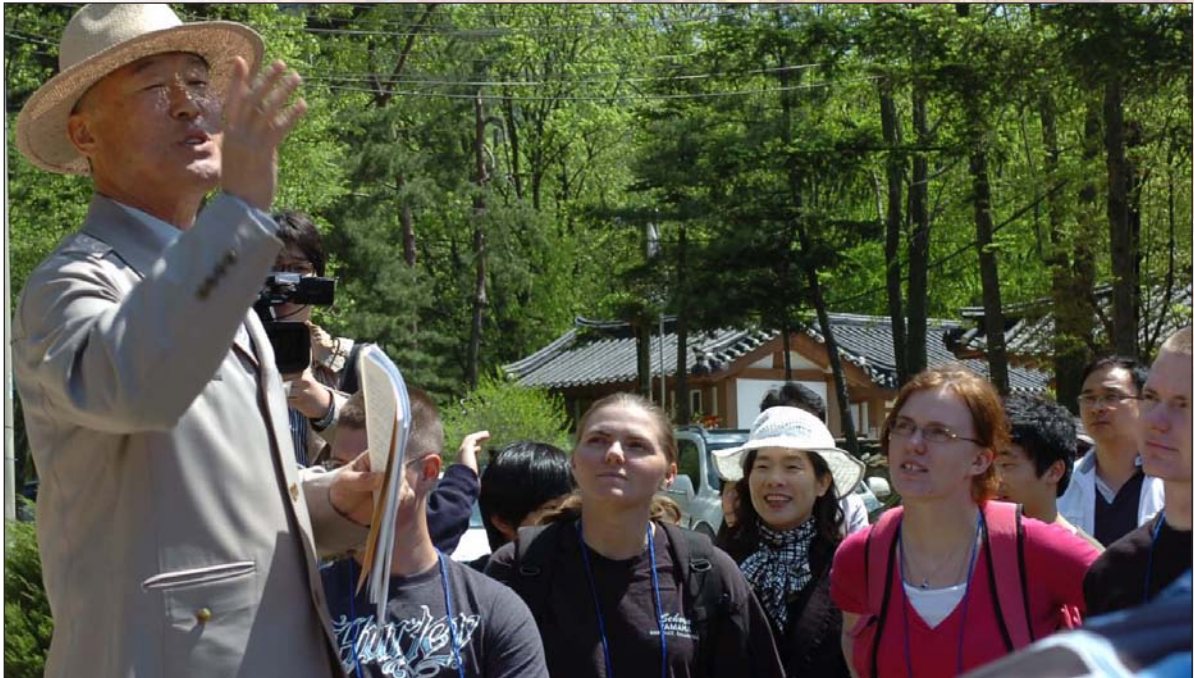
A guide shares information about the “Seo-oh-reung,” or west five royal tombs, with DSTB Soldiers and Daejin University students during a Korean heritage tour sponsored by Gyeonggi Province May 7.