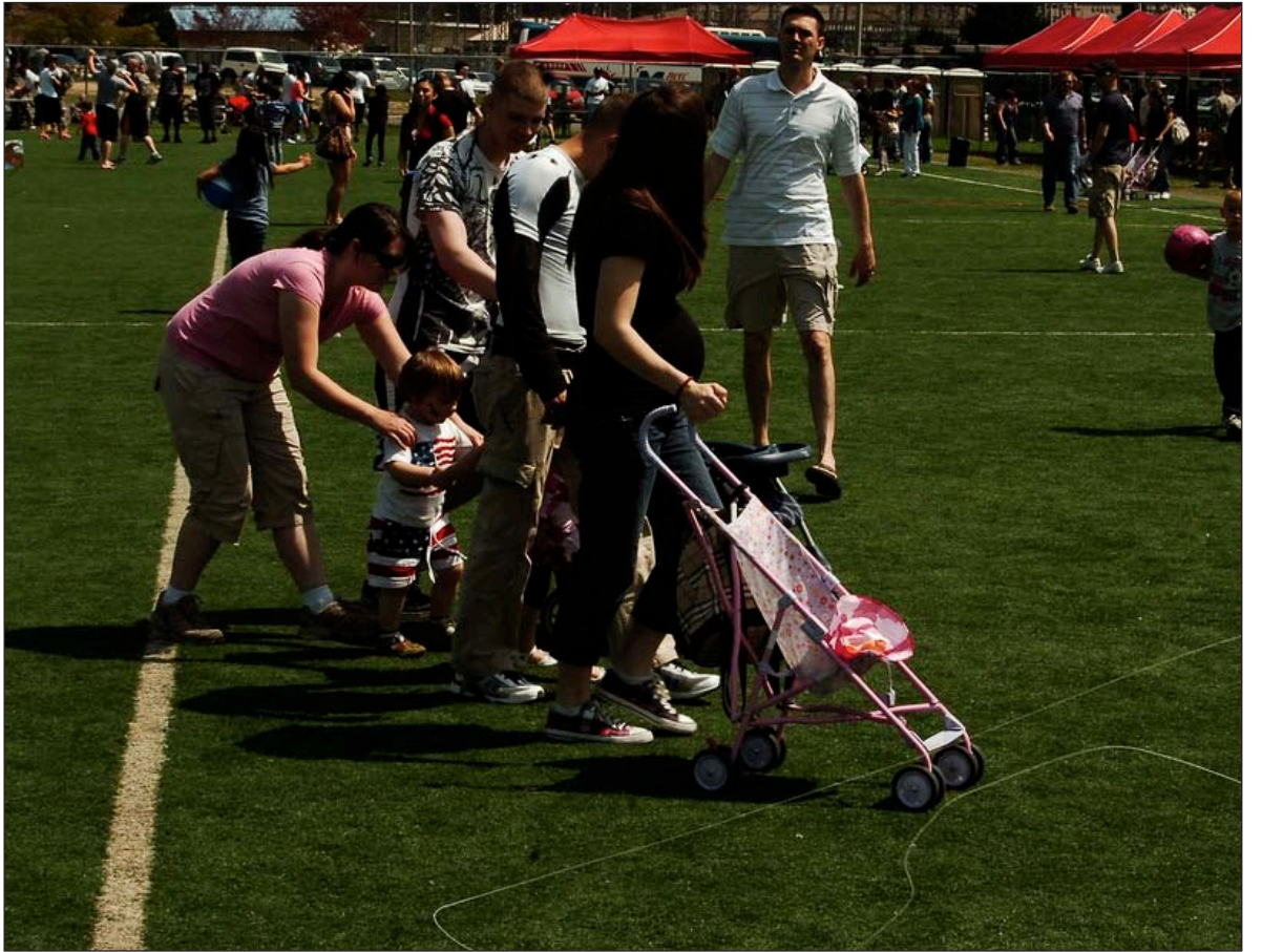
지난 5월 7일 캠프 케이시 (Camp Casey)의 캐리 필드 (Carey Field) 에서 미 2 사단 제 1전투여단의 봄 축제가 열렸다. 사진은 축제에 참여한 장병들과 가족들이 축제를 즐기며 단란한 한때를 보내고 있는 모습이다.