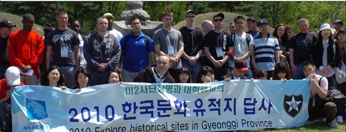
5월 7일, 미 2사단 장병들과 대전대학교 학생들이 함께 한국문화 유적지를 답사했다. 이번 행사는 미 2사단과 경기도청의 후원으로 이루어졌다. 사진은 장병들과 학생들이 함께 조를 지어 첫번째 목적지인 서오릉을 둘러본 뒤 찍은 기념사진이다.