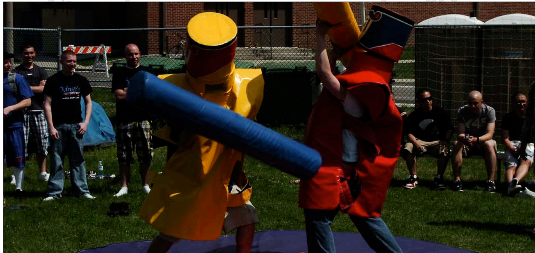
Soldiers enjoy a friendly battle of pugils during the 1st Heavy Brigade Combat Team Spring Festival held on the Camp Casey Carey Field May 7.