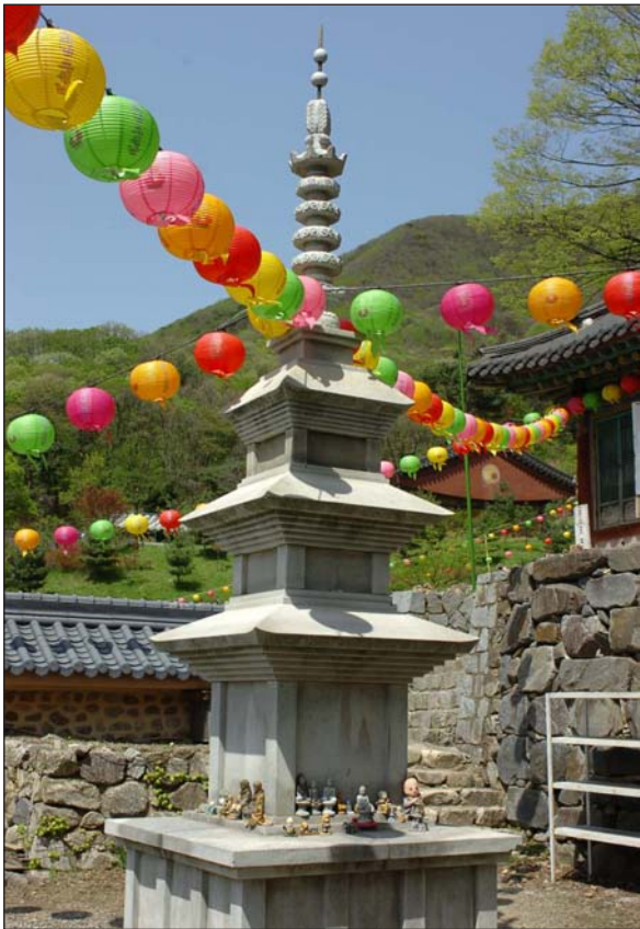
Warrior Division Soldiers learned about Korean heritage like this four-story stone tower, which lies in the “Bo-kwang-sa,” or Buddhist temple, during a tour sponsored by Gyeonggi Province May 7.

**All events will take place at the Gateway Park grass and concrete areas on Camp Casey**