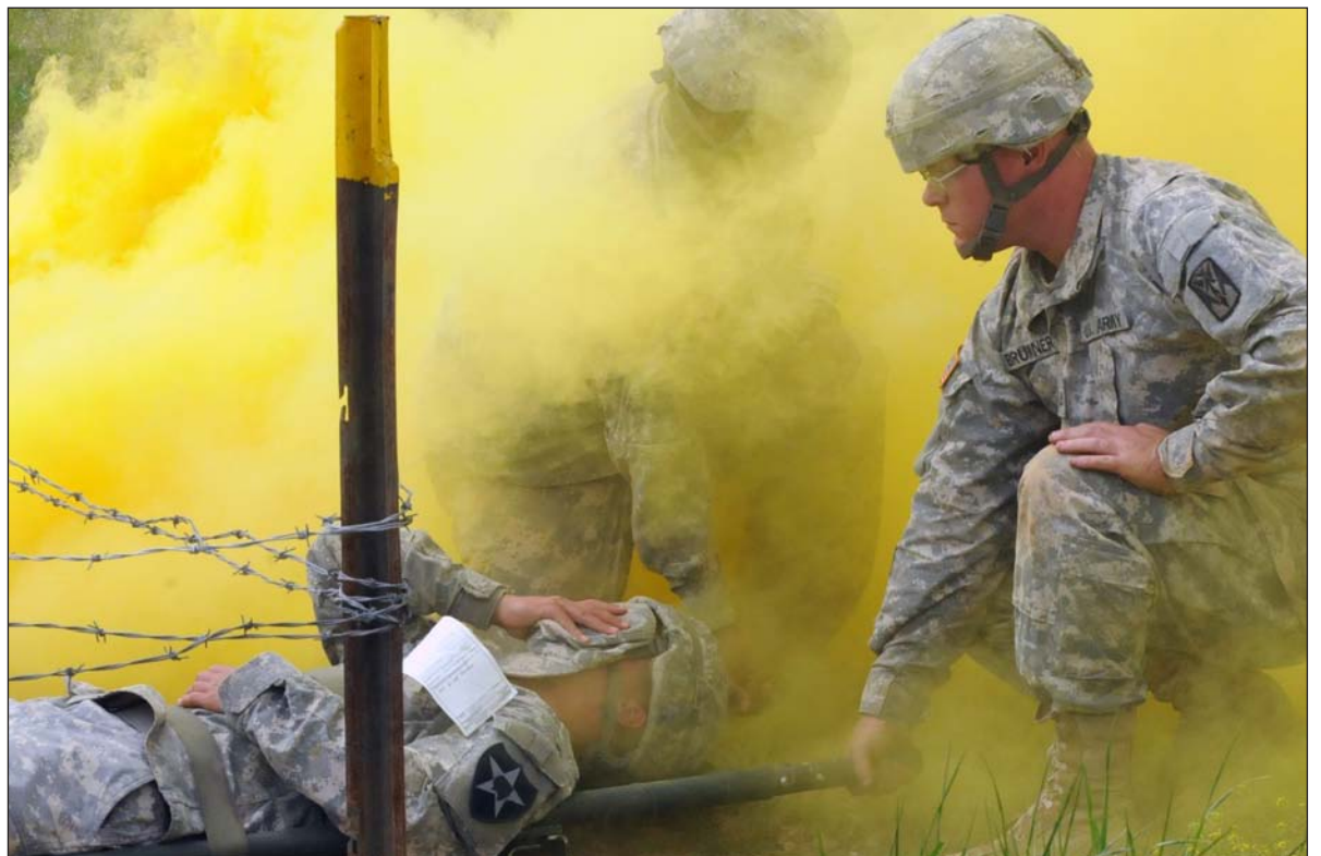
Medics navigate an obstacle course while carrying a loaded litter through combat training lane three of the Expert Field Medical Badge qualification at Warrior Base May 17.